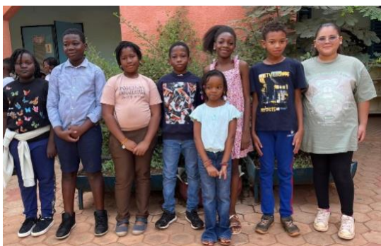
L'équipe rédactionnelle / P. 2

Les élèves de CM1A passionnés, créatifs et engagés dans la réalisation de leur journal scolaire.